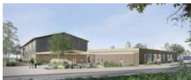
Vue côté rue Pierre de Coubertin

Voici quelques illustrations de ce nouveau projet enthousiasmant et d'ampleur pour notre commune avec des toitures végétalisées, des matériaux biosourcés, un étage en ossature bois et une structure au rez-de-chaussée en béton isolée par l'extérieur.