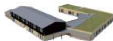
Vue Nord Est