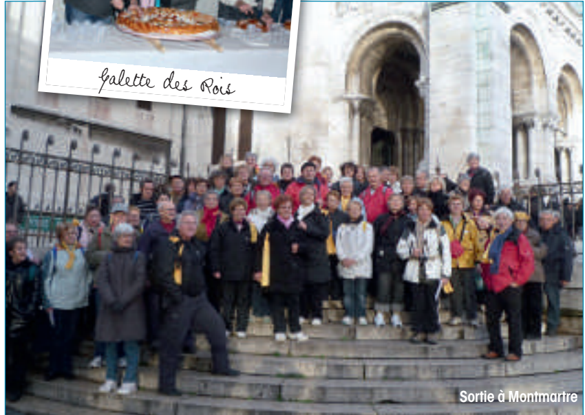
Sortie à Montmartre