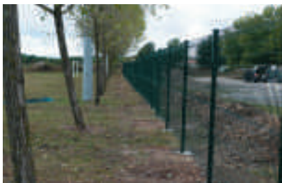
Une nouvelle clôture autour du stade

Le passage entre l'église et la poste est désormais éclairé et permet d'apprécier les palmiers mis en valeur.